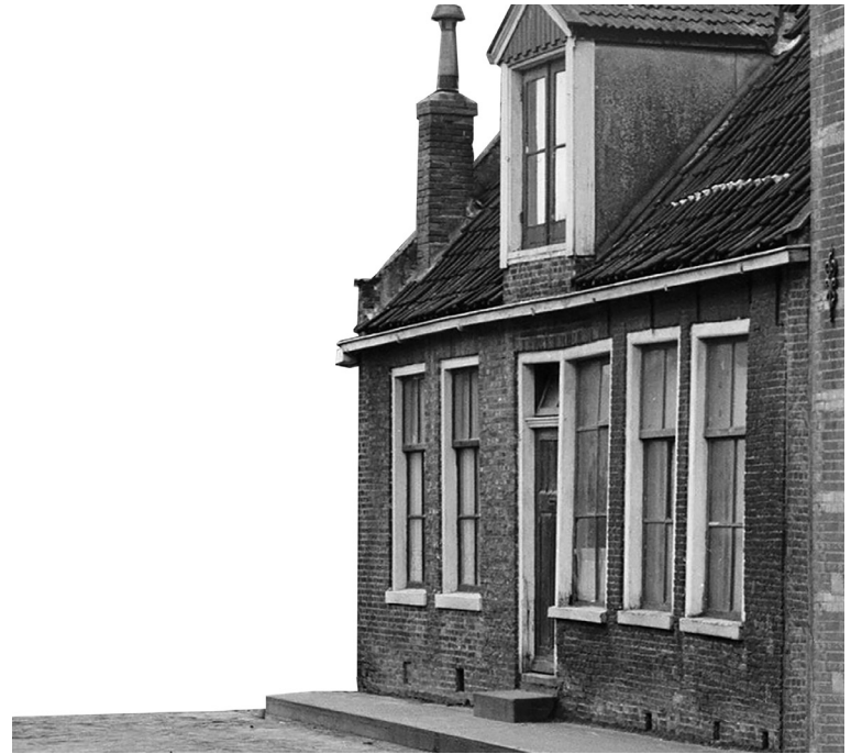
EERSTE WONING FAMILIE BOOMSMA OP HOEK KLEINE OOSTERSTRAAT