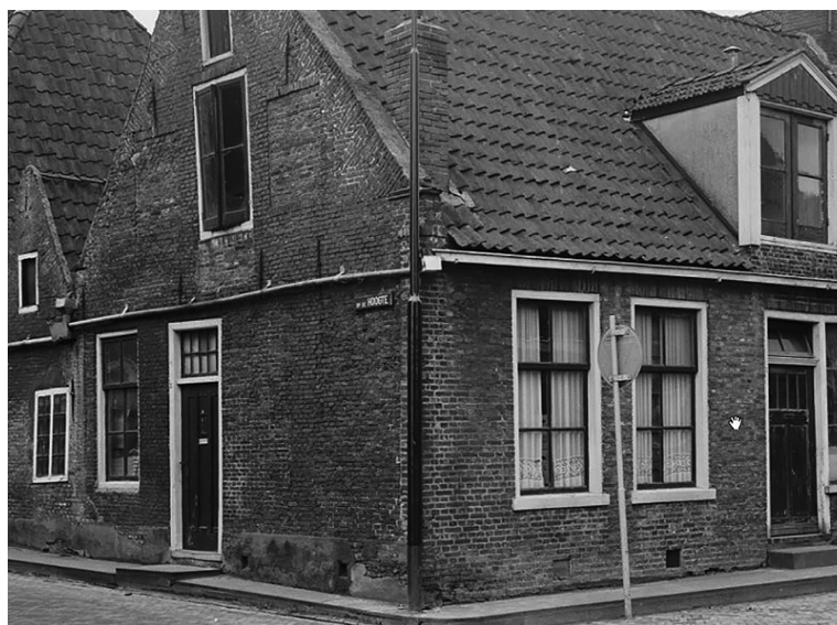
HOEK OP DE HOOGTE - KLEINE OOSTERSTRAAT