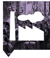
tijd van burgers en stoommachines

Wat te denken van twee tortelduiven. Zij zullen zoals gebruikelijk wel als weerprofeten in een kooitje boven de deur zitten. Als er regen komt koeren de duiven, maar dat hindert niet, want op de boedellijst staan ook twee paraplu's en die komen dan mooi van pas. Een oorijzer, een kerkboek maar ook een kerkstoof voor warme voeten in de kille Hervormde kerk op de Markt staan op de lijst. Sieraden, huishoudelijke artikelen, matten, gordijnen, gebruiksvoorwerpen en ga zo maar door. Wat het bedrijf betreft, aan rijdend materiaal: twee omnibussen, een jachtwagen, twee barouchettes, een vigelante en twee hooiwagens. Verder drie paarden, twee koeien, een schaap, een sik, hooi en handgereedschap. Drie paarden voor het vervoers- en scheepsjagersbedrijf lijkt te weinig. Mogelijk heeft Benardus 'zijn' paarden ergens anders gestald en zo buiten het boelgoed weten te houden.