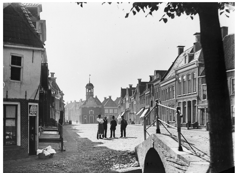
GROTE BREEDSTRAAT ROND 1900